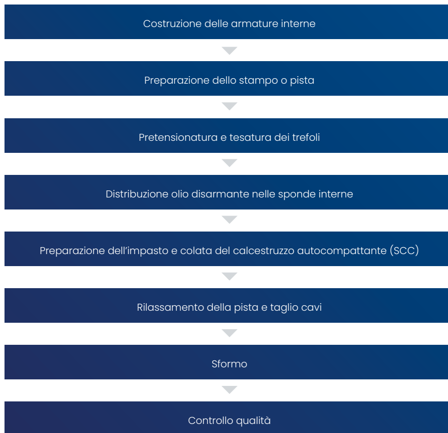
Figura 3: Schema ciclo produttivo trave prefabbricata

L'impasto confezionato, attraverso l'impianto di distribuzione aerea, viene consegnato presso lo specifico stampo di getto per la realizzazione del manufatto. Il ciclo produttivo viene ultimato al raggiungimento delle resistenze meccaniche minime necessarie ad eseguire le operazioni di rilassamento della pista e taglio cavi, delle successive operazioni di sformo e controllo qualità sul prodotto finito che anticipano l'allocazione presso lo stoccaggio interno aziendale, in attesa di procedere all'invio del manufatto presso il cantiere di posa.