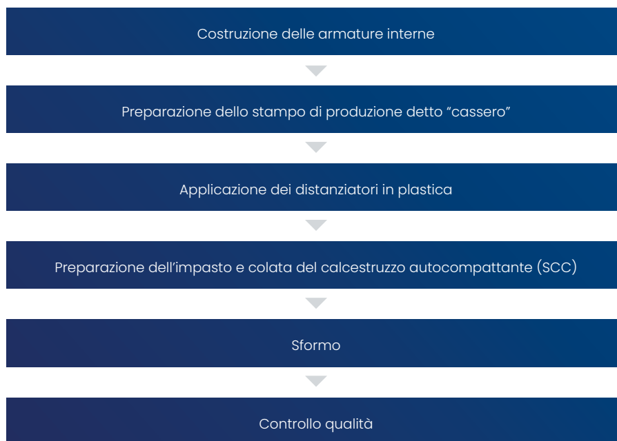
Figura 3: Schema ciclo produttivo pilastro prefabbricato

Al raggiungimento delle resistenze meccaniche previste si succedono le operazioni di sformo, mentre, ulteriori controlli di qualità sul prodotto finito anticipano l'allocazione presso lo stoccaggio interno aziendale, in attesa di procedere con l'invio del manufatto presso il cantiere di posa.