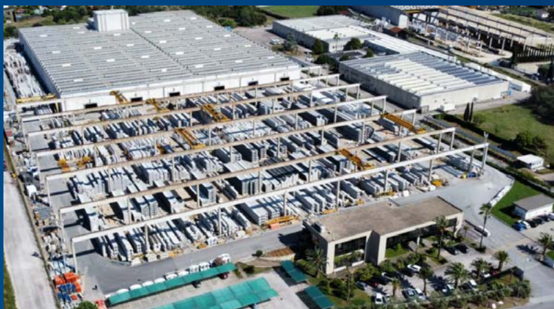
Figura 1: Stabilimento di Aprilia (LT) – UP3

Lo stabilimento di Aprilia (UP3) possiede una superficie di 102.000 mq di cui 24.000 coperti, ha una capacità produttiva di c.a. 50.000 mc/anno ed un'area di stoccaggio di 28.200 mq .